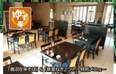
「鹿沼在来そば」&「新里ねぎ」ツアー特別メニュー

【新里ねぎ】は地理的表示法に基づき、 生産地や品質基準と共に2017年5月農林水産省の GI (地理的表示)登録になりました。