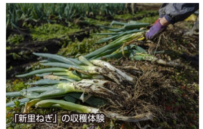
「新里ねぎ」の収穫体験