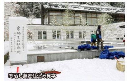
寒晒し蕎麦仕込み見学