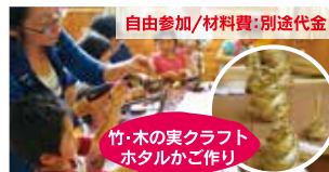
竹・木の实クラフト ホテルかご作り

参加者 限定特典! ○当日作ったお茶は 当日お土産 ○ティータイム。 八溝紅茶とお菓子 ○地元野菜のお土産