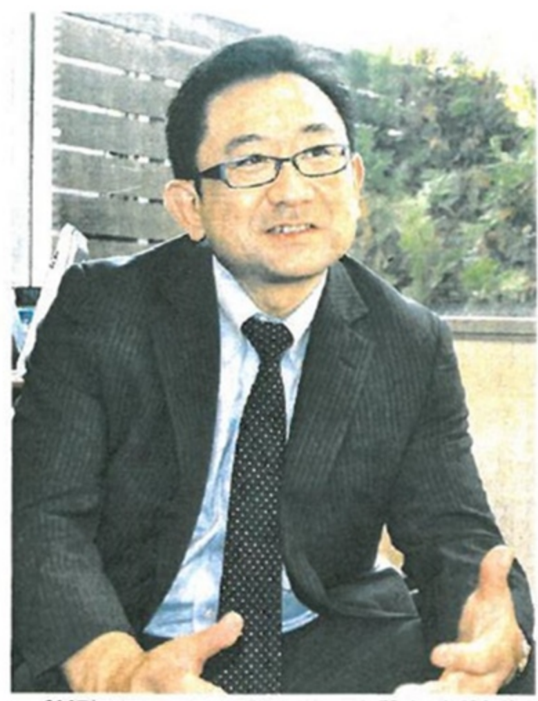
2007年、ファーマーズ・フォレスト設立。会社経営の傍ら、「農業と食、地域資源を結ぶ総合プロデューサー」として全国各地で農業支援、地域活性化に取り組む。中小企業診断士、食糧連携コーディネーター、6次産業化プランナー。内閣府「食の6次産業化プロデューサー・キャリア段位制度」レベル認定委員、自らレベル4の最高段位を取得している。

【栃木のえにしトラベル事業】 弊社が展開する旅行ブランド「えにしトラベル」は、平成24年に第一種旅行業登録して業務を開始しました。着地型旅行といわれるもので、大手旅行会社のパッケージツアーとは若干視点や異なり、地域の人・モノ・コトといったさまざまな資源を活用して、ご当地側で企画から運用までを行うものです。 コンセプトは「驚きと発見、美味しさと感動に出会える新しい地旅の提案」。栃木県のさまざまな魅力を深掘りするプログラムを、地域の人たちと共に創っています。ツアーレジェーターが地域の魅力を伝え、地元の方々に「プレーヤー」としてお 【地型旅行づくり】 ■宇都宮市の大谷地域で実施している探石場跡地の活用事業