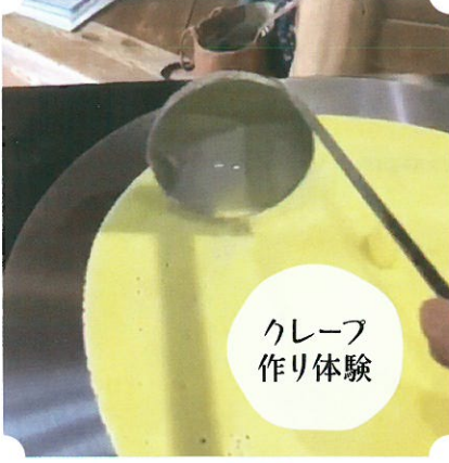
クレープ 作り体験