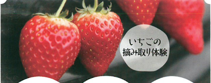
いちごの 摘み取り体験