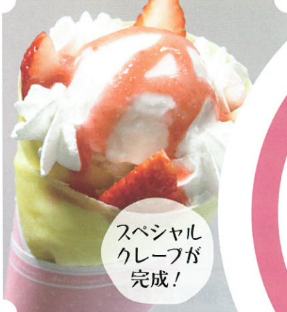
スペシャル クレープが 完成!