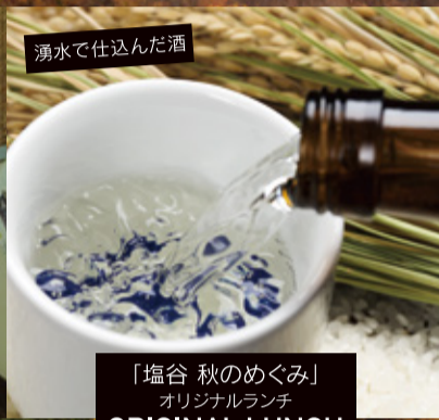
湧水で仕込んだ酒

「塩谷 秋のめぐみ」 オリジナルランチ ORIGINAL LUNCH 塩谷の水から生まれた スイーツ付き