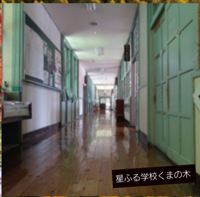
星ふる学校くまの木