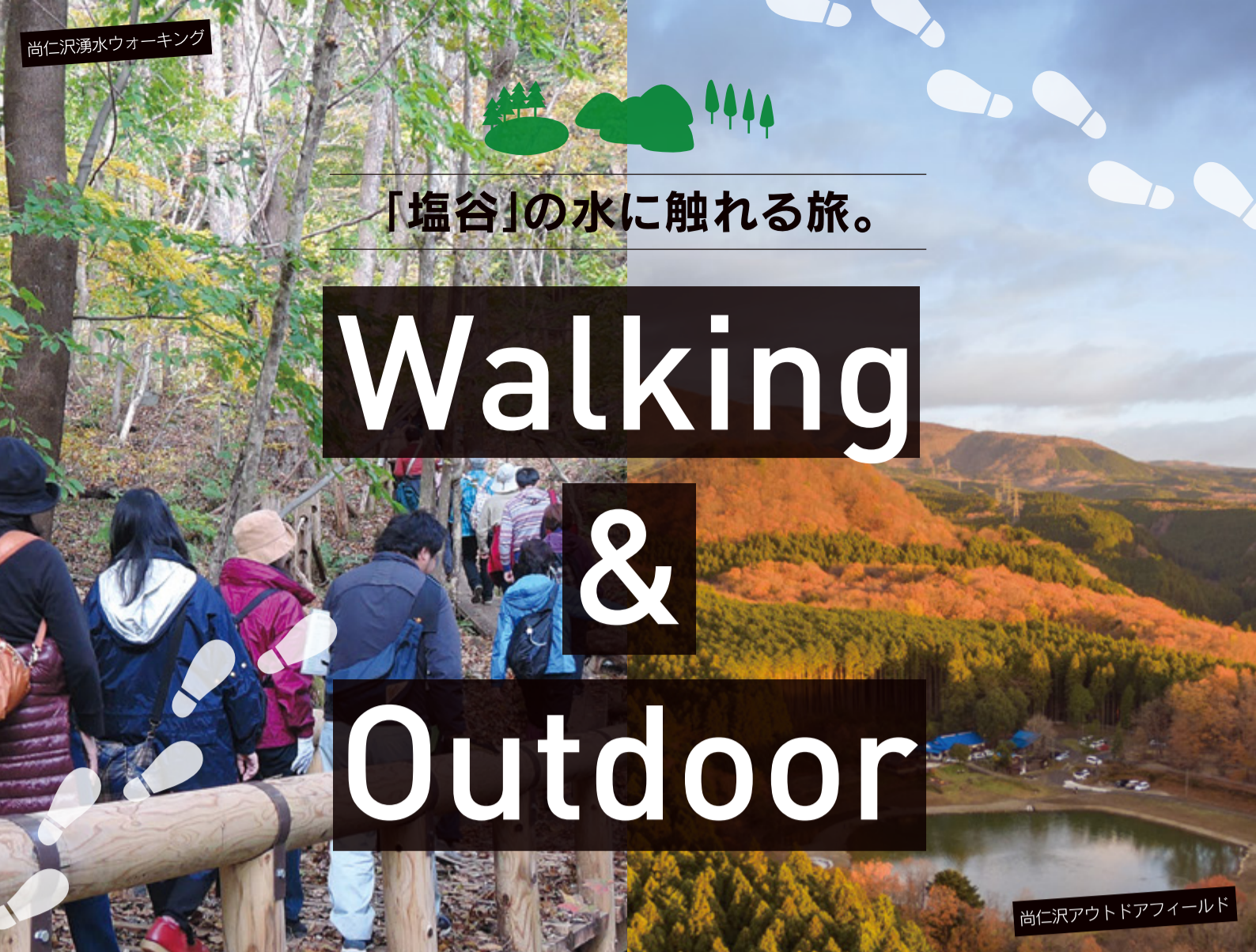
尚仁沢アウトドアフィールド