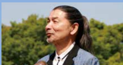
陶製の笛オカリナの第一人者 宗次郎