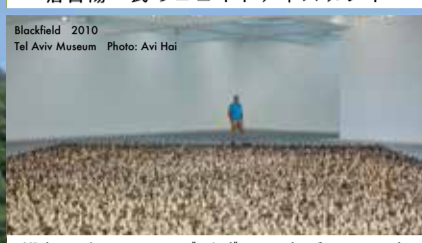
ザドック・ベン=デイヴィッド氏のアート