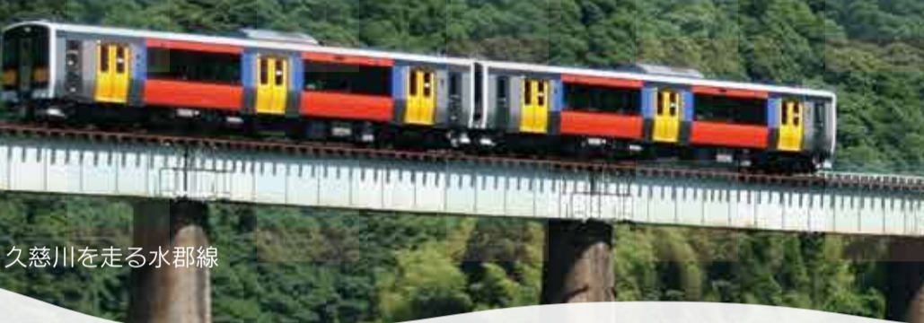
久慈川を走る水郡線