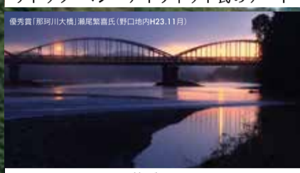
那珂川にかかる茨城百景の那珂川大橋