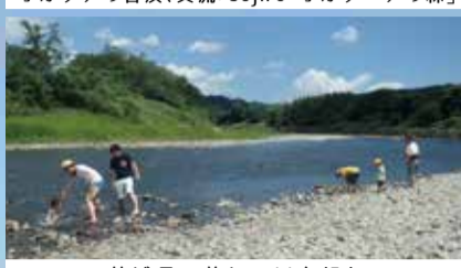
茨城県美しい川を望む