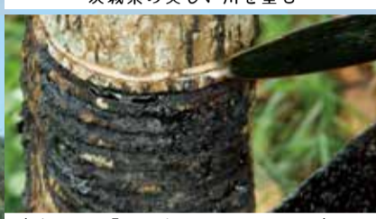
漆をヘラで「掻きとって」採取する、漆かき