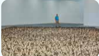
Blackfield 2010 Tel Aviv Museum

11:20 KENPOKU ART [旧家楽青少年の家] ミニチュア・オブジェで構成されたインスタレーションを制作するザドック・ベン=デイヴィッド氏のアート作品を鑑賞。