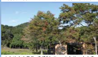
オカリナの普及、交流「Sojiro オカリナの森」