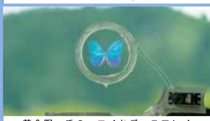
落合陽一氏のコロイドディスプレイ