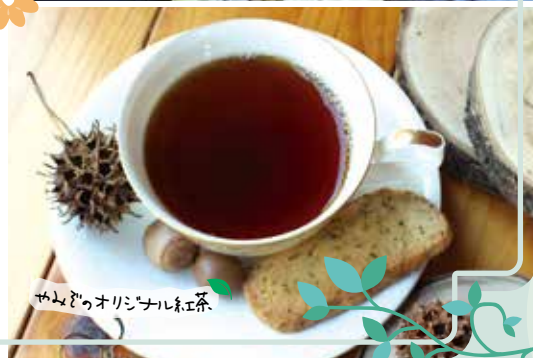
やみぞオリジナル紅茶