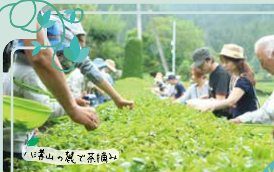
八溝山の麓で茶摘み