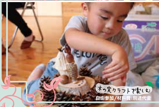
木の実クラフトを楽しむ 自由参加/材料費・別途代金