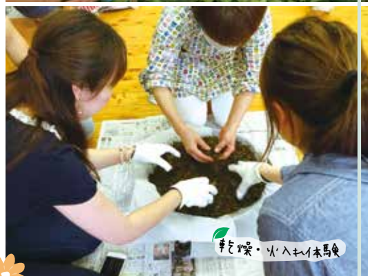
手ごね・火入れ一本馬舎