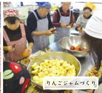
りんごジャムづくり