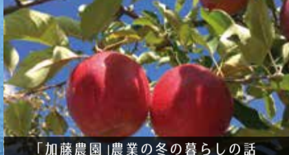
「加藤農園」農業の冬の暮らしの話