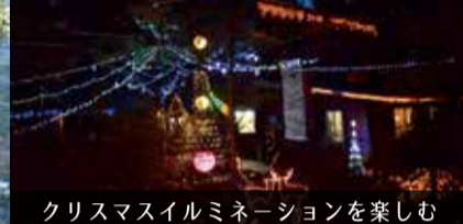
クリスマスイルミネーションを楽しむ