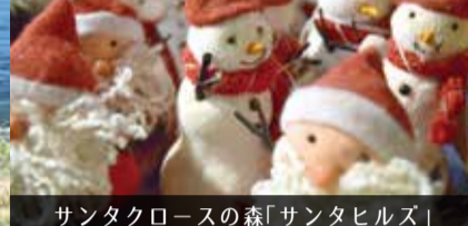
サンタクロースの森「サンタヒルズ」