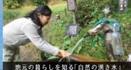
地元の暮らしを知る「自然の湧き水」