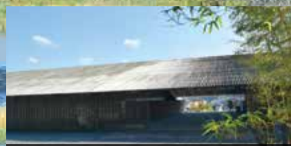
浮世絵師「歌川広重」の作品が並ぶ「馬頭広重美術館」