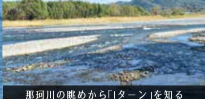
那珂川の眺めから「1ターン」を知る