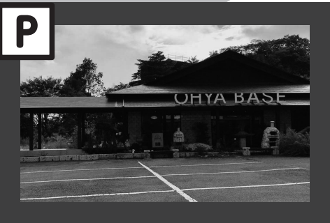
OHYA BASE (レストラン OHYA FUN TABLE 奥)